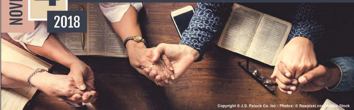
Copyright © J.S. Paluch Co. Inc.

You shall love your neighbor as yourself. Mark 12:31